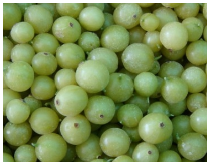
Ērkšķogas 4x2,5 kg