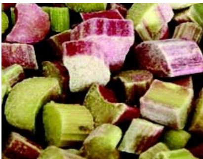
Rabarberi 4x2,5 kg