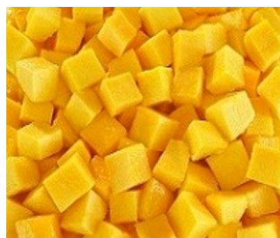
Mango kubiciņi 10x10 mm