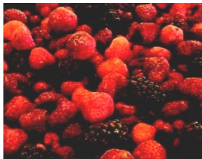
Ogu asorti Zemenes, jānogas, kazeses, avenes, mellenes, upenes 4x2,5 kg