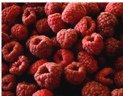
Avenes 4x2,5 kg