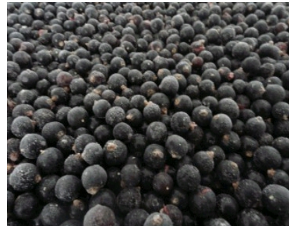
Upenes 10 kg